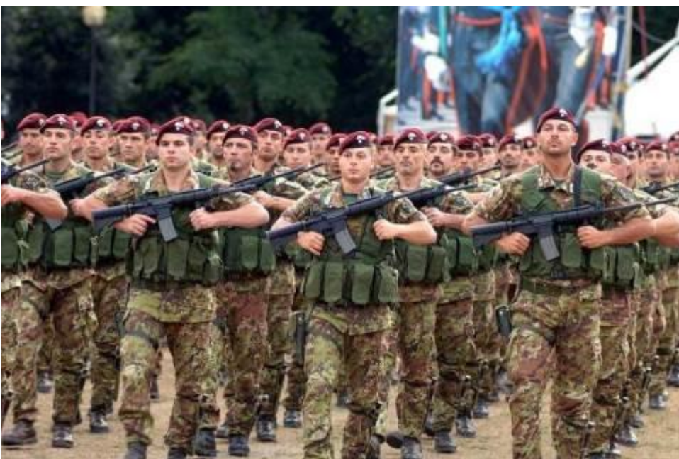
1° Reggimento Paracadutisti Folgore

Nel 1968 dopo gli studi, svolge il servizio militare a Pisa e poi a Livorno nel corpo dei Paracadutisti e Sommozzatori della Folgore dove compie missioni con gli incursori della marina del Battaglione San Marco.