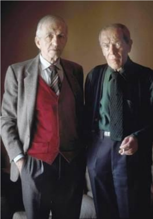
Fruttero e Lucentini