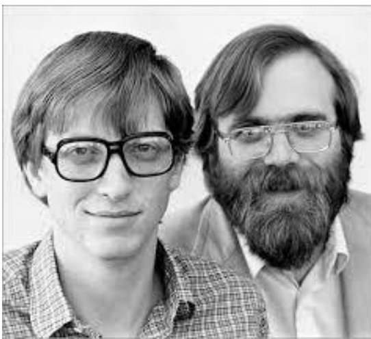
Paul Allen e Bill Gates