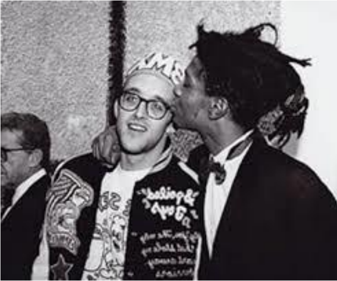
Jean-Michel Basquiat e Keith Haring

ed Eleana Sonnabend e tramite loro Rauschenberg, Warhol, Dine, Wesselmann, Twombly, Lichtenstein, Indiana, Oldenburg, fino ai minimalisti Sol LeWitt, Carl Andre, Bob Morris ed altri. A New York conosce e frequenta Basquiat e Keit Haring